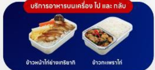
บริการอาหารบนเครื่อง ไป และ กลับ