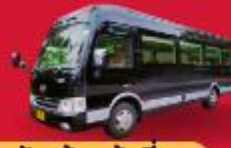
BUS (10-18 ท่าน)