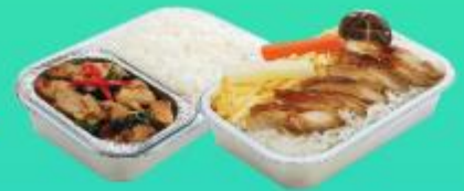
บริการอาหารร้อนบนเครื่องบิน ขาไป - ขากลับ