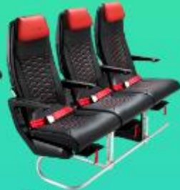
ที่นั่ง HOT SEAT