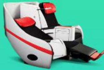
พรีเมียมฟลัดเบด