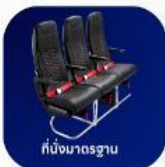
ที่นั่งมาตรฐาน