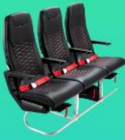
ที่นั่งมาตรฐาน

คณะพร้อมกัน ณ อาคารผู้โดยสารขาออกระหว่างประเทศ ชั้น 3 ประตู 1 สนามบินนานาชาติดอนเมือง เดาน์เตอร์ สายการบิน THAI AIR ASIA X (XJ) พบเจ้าหน้าที่ของบริษัทฯ คอยให้การต้อนรับและอำนวยความสะดวก