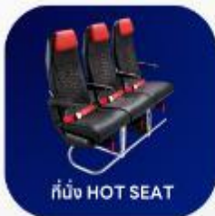
ที่นั่ง HOT SEAT