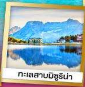
ทะเลสาบมิซูรีน่า