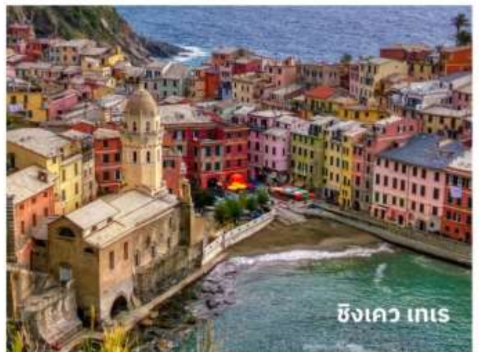
ซังควา เทเร

ท่านสามารถทำการสแกน QR CODE นี้ เพื่อรับชม “ซังควาเทเร” ในรูปแบบวิดีโอ