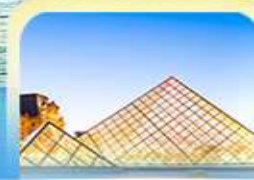
พีระมิดทูลูส์