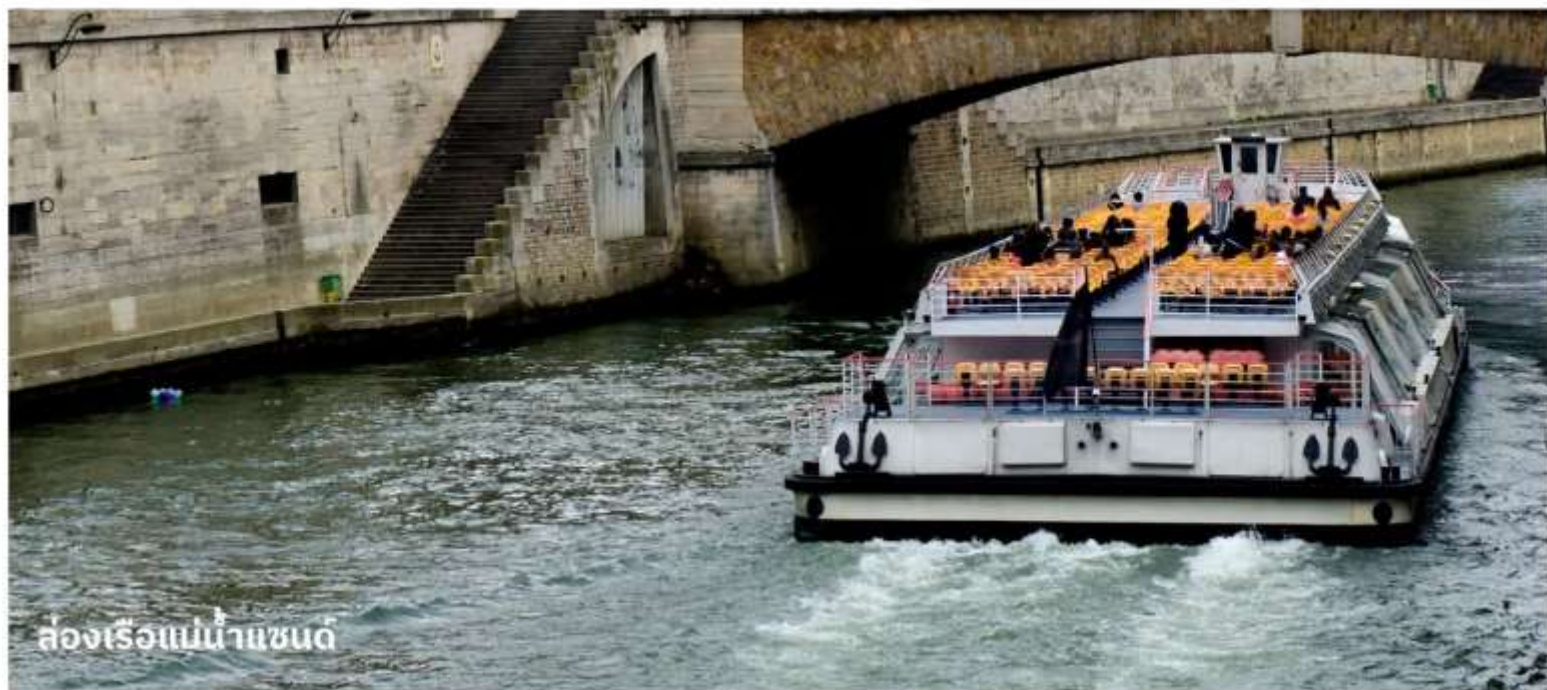
ล่องเรือแม่น้ำแซน