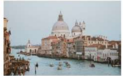
แกรนด์คาแนล

นำทุกท่านนั่งเรือต่อเพื่อไปยัง ท่าเรือซานมาร์โค (San Marco Pier) บนเกาะเวนิส แวะให้ท่านถ่ายรูปสวยๆ เก็บเป็นที่ระลึกกันที่ พระราชวังดอดจ์ พระราชวังริมน้ำแสนอลังการ ที่สร้างตั้งแต่ศตวรรษที่ 14 ในสไตล์เวเนเซียนโกธิค ที่เคยเป็นที่ประทับของผู้ปกครองของเวนิส แต่ตั้งแต่ปี 1923 ก็ได้เปลี่ยนเป็นพิพิธภัณฑ์ให้คนทั่วไปได้เข้าชม เป็นหนึ่งในแลนด์มาร์กหลักของเวนิส จากนั้นเดินเที่ยวชมแลนด์มาร์คสำคัญต่างๆ ในเมือง จัตุรัสเซนต์มาร์ค เป็นจัตุรัสหลักของเมืองเวนิส และยังเป็นศูนย์กลางเมืองตั้งแต่โบราณ จากนั้นนำท่านถ่ายรูปกับ มหาวิหารเซนต์มาร์ค มหาวิหารใหญ่ ของศาสนาคริสต์นิกายโรมันคาทอลิก อลังการด้วยการตกแต่งด้วยโดมใหญ่ และที่อยู่ติดกันและโดดเด่นด้วยความสูงถึง 50 เมตรก็คือ หอรบั้ง ถือเป็นหนึ่งในสัญลักษณ์ของเมืองที่ เห็นได้ไม่ว่าจะอยู่มุมไหนของเมืองก็ตาม และที่พลาดไม่ได้เลยก็คือ สะพานถอนหายใจ สะพานอันโด่งดังแห่งนี้ตั้งอยู่เหนือแม่น้ำที่คั่นกลางระหว่างคูเก่ากับพระราชวังดอดจ์