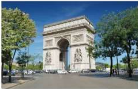
ประตูชัย

นำท่านเดินทางเข้าสู่ หอไอเฟล ถ่ายรูปเป็นที่ระลึกกับสัญลักษณ์ที่โดดเด่นสูงตระหง่านคู่นครปารีส จากนั้นนำท่านเดินทางเข้าสู่ย่านใจกลางเมืองปารีสเพื่อ ถ่ายรูปกับประตูชัย อีกหนึ่งสัญลักษณ์ของมหานครแห่งนี้ และเดินทางสู่ พิพิธภัณฑ์ลูฟร์ ให้ท่านได้ถ่ายรูปด้านหน้าพีระมิดแก้วของพิพิธภัณฑ์ลูฟร์ เป็นพิพิธภัณฑ์ทางศิลปะที่มีชื่อเสียงที่สุด เก่าแก่ที่สุดและใหญ่ที่สุดแห่งหนึ่งของโลก