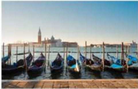
เรือกอนโดล่า

นำท่านออกเดินทางสู่ ท่าเรือตรอนเคโต เพื่อเตรียมตัวนั่งเรือข้ามสู่เกาะเวนิส เกาะเวนิสเป็นดินแดนแสนโรแมนติก เป็นเมืองที่ไม่เหมือนใคร โดยใช้เรือแทนรถ ใช้คลองแทนถนน มีสมญานามว่าเป็น “ราชินีแห่งทะเลเอเดรียติก” มีเกาะน้อยใหญ่กว่า 118 เกาะและมีสะพานเชื่อมถึงกัน กว่า 400 แห่ง