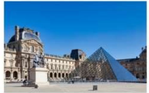
พิพิธภัณฑ์ลูฟร์

หลังจากนั้นนำท่านเดินทางสู่ La Vallee Village Outlet