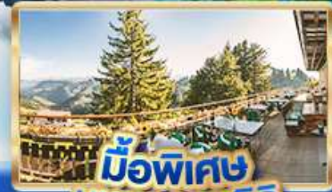
มือพิเศษ บียอดเวนิซิช