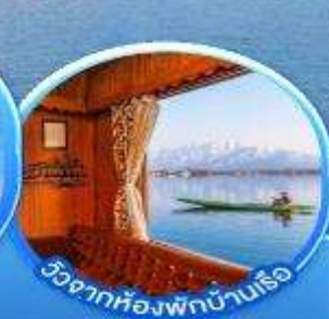
วิวจากห้องพักบ้านเรือ