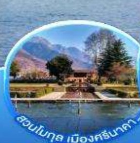
สวนโมกุล เมืองศรีนาคา