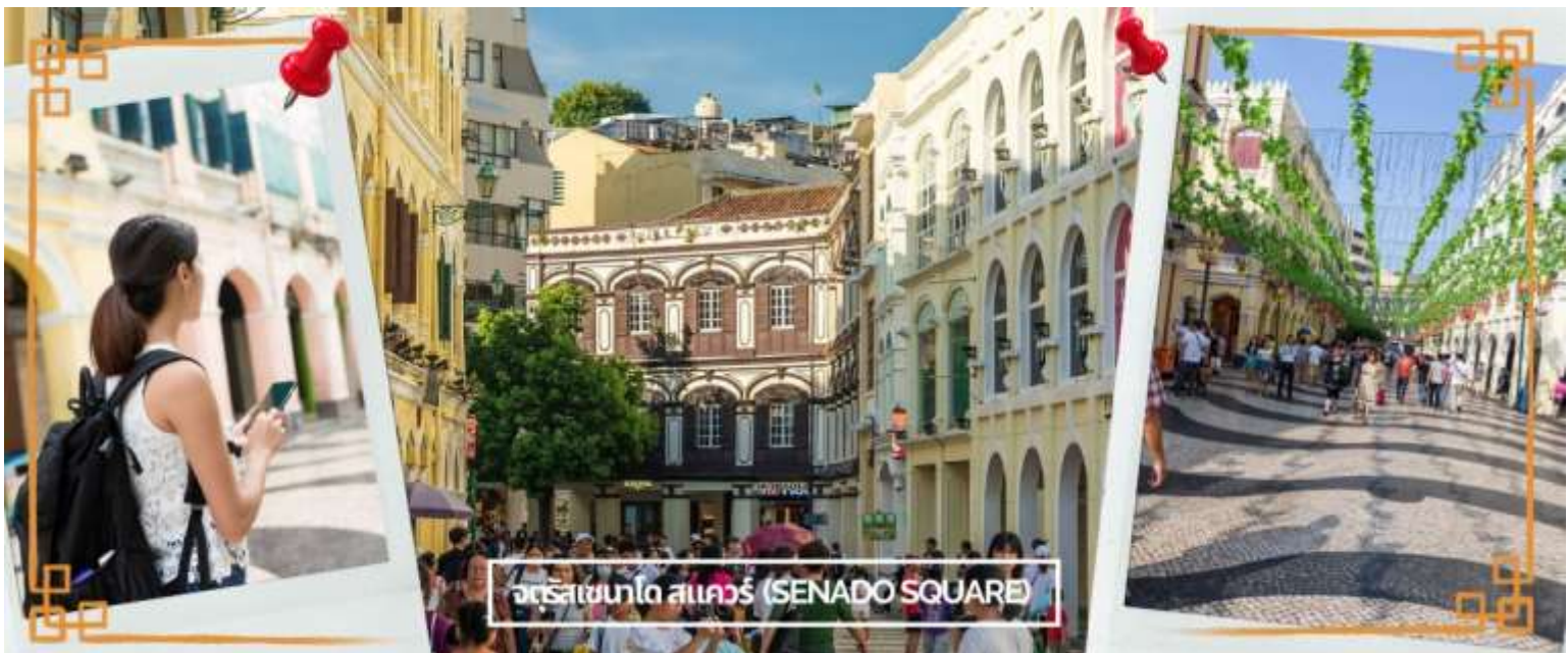
จัตุรัสเซนาโด สแควร์ (SENADO SQUARE)

จากนั้นนำท่านเดินทางสู่ อนุสรณ์สถาน ดร.ซุนยัตเซ็น (Dr. Sun Yat-Sen Memorial Hall) ที่สร้างขึ้นเพื่อรำลึกถึง ดร. ซุนยัตเซ็น ซึ่งถือว่าเป็นบิดาของชาวจีน เป็นผู้ปลดปล่อยชาวจีนจากระบอบสมบูรณาญาสิทธิราชย์ ที่ปกครองประเทศจีน มาเป็นเวลาหลายพันปี โดยบ้านเกิดของเขานั้นก็อยู่ที่ เมืองเซียงซัน ในกว่างเจา ภายในอนุสรณ์สถานนั้น เป็นหอประชุม ขนาดใหญ่รูปทรงแปดเหลี่ยม ที่ได้รับการยกย่องว่าเป็นสถาปัตยกรรมชิ้นเยี่ยม เพราะสร้างขึ้นโดยไม่มีเสากลางห้องที่จะบด บังสายตาของผู้ชมที่มองไปยังเวที ภายในหอประชุมนั้น มีประวัติของ ดร.ซุนยัตเซ็นได้ให้อ่านกัน และบริเวณด้านหน้า หอประชุมก็มีอนุสาวรีย์ของ ดร.ซุนยัตเซ็น ยืนเด่นเป็นสง่า เป็นจุดที่นักท่องเที่ยวทุกคนจะต้องเก็บรูปไปเป็นที่ระลึกอีกทั้ง บริเวณรอบๆหอประชุมยังจัดทำเป็นสวนสาธารณะให้ประชาชนเข้ามาพักผ่อนหย่อนใจกัน