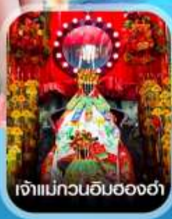
เจ้าแม่ทวนอิมฮ่องกง