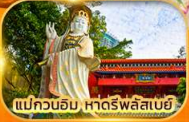
แม่กวนอิม หาดรีพลัสเบย์