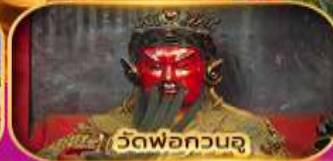
วัดพ่อกวนจู