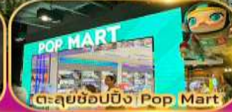
ต.ลุยซื้อป๊อป | Pop Mart