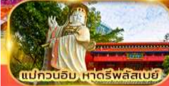
แม่กวนอิม หาดริฟลิสเบย์