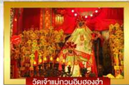
วัดเจ้าแม่กวนอิมฮองฮ่า