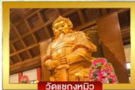
วัดแชกงหมิว