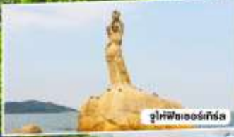
จูไห่พีทเออซังเกี๊ยะ