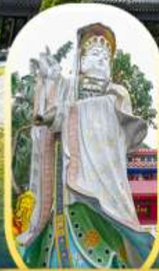
วัดเจ้าแม่กวนอิมรี พลัสเบย์