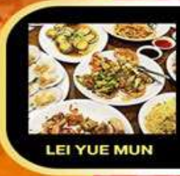
LEI YUE MUN