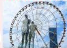
รูปปั้นอาลีและนีโน