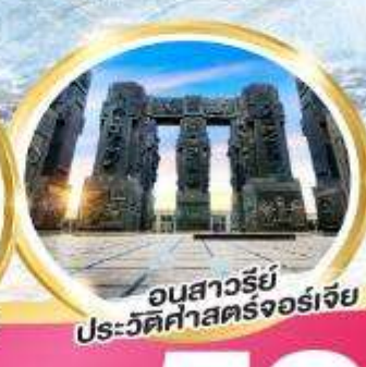
อนสาวรีย์ประวัติศาสตร์จอร์เจีย