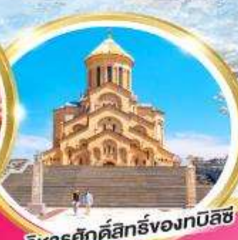
วิหารศักดิ์สิทธิ์ของทบิลีซี