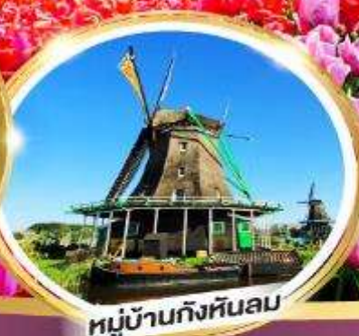
หมู่บ้านกังหันลม