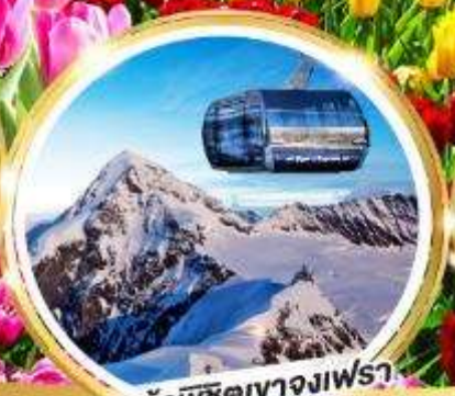
กระเช้าพิชิตเขาจุงเฟรา