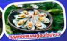
เมนูหอยแมลงภู่ออบไวน์ขาว