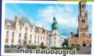
ทอร์ซิงเมืองบรูจส์