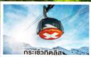
กระเช้าทิตลิส