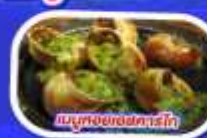
เมนูหอยแมลงภู่ออบไวน์ขาว

ทานอาหาร ณภัตตาคารบนหอไอเฟล พร้อมชมวิวแสนโรแมนติก เมนูหอยแมลงภู่ออบไวน์ขาว