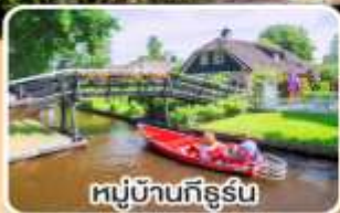
หมู่บ้านทึร์รึน