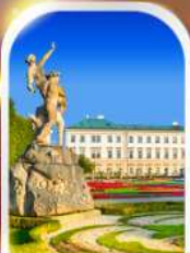
MIRABELL PALACE AUSTRIA