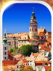
CESKY KRUMLOV CZECH