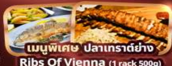
เมนูพิเศษ ปลาเทราต์ย่าง Ribs Of Vienna (1 rack 500g)

กาสิโน 15 ท่านออกเดินทาง พร้อมหัวหน้าทัวร์คนไทย