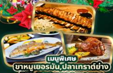
เมนูพิเศษ ขาหมูเยอรมัน, ปลาเทราต์ย่าง Ribs Of Vienna (1 rack 500g)

บริการนำดื่มวันละ 1 ขวด ฟรี! ปลั๊กไฟยูนิเวอร์แซล