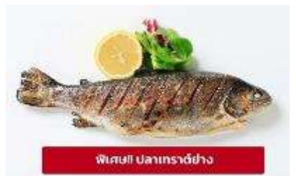
พิเศษ! ปลาเทราต์ย่าง

เกียง 🍴 รับประทานอาหารเช้า (มือที่6) เมนูพิเศษ ปลาเทราต์ย่างท่านละ 1 ตัว นำท่านเดินทางสู่ เมืองมรดกโลกเชสกี คุรมลอฟ (Cesky Krumlov) สาธารณรัฐเช็ก (ระยะทาง 210 กม./ 3.30 ชม.) ล้อมรอบด้วยแม่น้ำ Vltava ทำให้เมืองแห่งนี้มีลักษณะคล้ายหยดน้ำ จนถูกขนานนามว่าเป็น "เมืองหยดน้ำ" จากนั้นนำท่านถ่ายรูปบริเวณนอก ปราสาทคุรมลอฟ (Cesky Krumlov Castle) เป็นปราสาทกอธิคดั้งเดิม ตั้งอยู่ริมฝั่ง