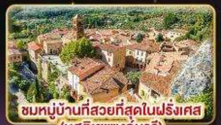
ชมหมู่บ้านที่สวยงามที่สุดในฝรั่งเศส (มูสติเยแซงท์มาร์)