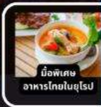
มือพิเศษ อาหารไทยในยุโรป