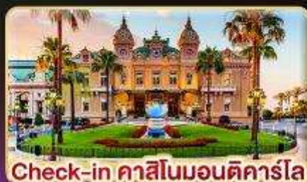
Check-in คาสีโนมอนติคาร์โล