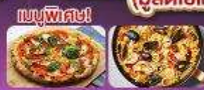
เมนูพิเศษ!