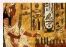
พิพิธภัณฑ์สถานแห่งชาติอียิปต์