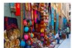
ตลาดข่านเอลคาลิลี

20.50 น. ออกเดินทางสู่อิสตันบูล เที่ยวบิน TK695