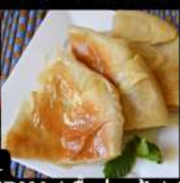
เมนูสุดพิเศษ !! KOSHARI (ข้าวคั่วกั่ว) / SHAWERMA (เนื้อห่อแป้ง) / FITEER BALADI (พิซซ่าอียิปต์)