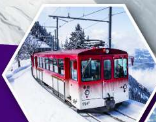
นั่งรถไฟใต้เขาริกิ