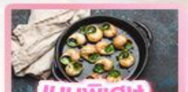
เมนูพิเศษ หอยออสตาโก้

เยอรมัน เนเธอร์แลนด์ เบลเยียม ฝรั่งเศส Keukenhof