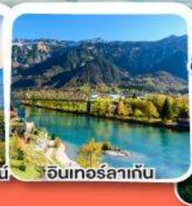
อินเทอร์ลาเก็น