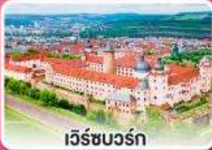
เวิร์ชบวร์ค