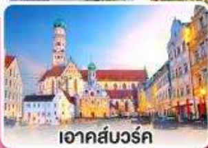
เอาคส์บวร์ค