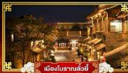
เมืองโบราณลวี่ซี