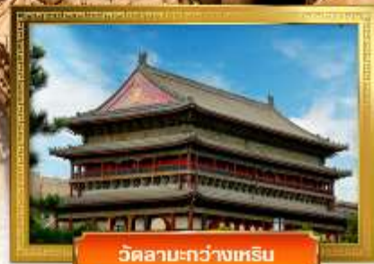
วัดลามะ-กว่างเหฺริน