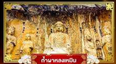
กำแพงหลงเหมิน