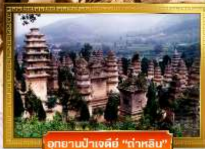
อุทยานป่าเจดีย์ "ต้าหลิน"