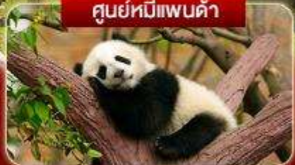
ศูนย์หมีแพนด้า

เดินทาง สัตว์ป่า หุบเขาของเอียวโกว จี๋จ้ายโกว เม่าเสี้ยน กระเช้าขึ้นภูเขาคิมะต้ากู่การ์เซีย รถไฟความเร็วสูงกลับเมือง แพนด้าชอฟี ไท่กู่ลี ศูนย์แพนด้า แพนด้าปิ่นตึก IFS ซุนซีลู่ ซอยกว้างแคบ ชมแสงไฟลานห้าง SKP วัดต้าอ้อ