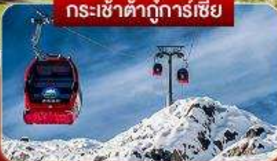
กระเช้าต้ากู่การ์เซีย