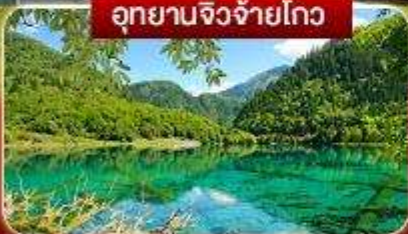
อุทยานจี๋จ้ายโกว