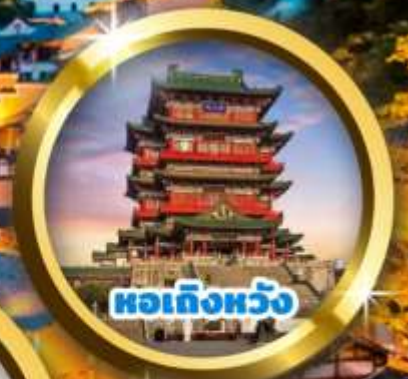
หอเกิ่งหวัง