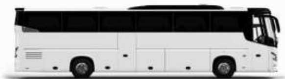
ตัวอย่างรถทัวร์ 1 ชั้น

ค่าที่พักตามที่ระบุในรายการหรือเทียบเท่าระดับเดียวกัน (ห้องพักละ 2 ท่าน) หากประเภทห้องที่ท่านริเวสณาเกินจาก เช่น ริเวสคองพักเป็น TWIN BED หรือ DOUBLE BED ทางบริษัทขอสงวนสิทธิ์ในการปรับประเภทห้องพัก เป็นตามที่โรงแรมมีอยู่ โดยไม่ต้องแจ้งให้ทราบล่วงหน้า