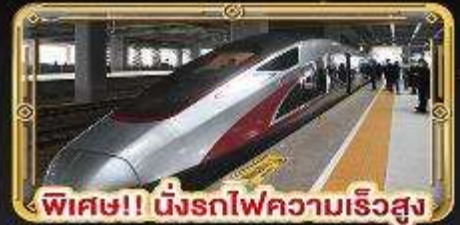
พิเศษ!! นิ่งรถไฟความเร็วสูง