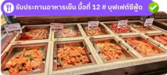
รับประทานอาหารเย็น มื้อที่ 12 # บุฟเฟต์ซีฟู้ด

ได้เวลาอันสมควร นำทุกท่านเดินทางสู่ สนามบินฉางซา