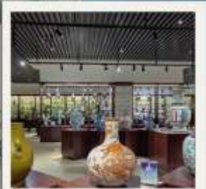
JINGDEZHEN CERAMIC MUSEUM