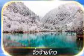
จิวจ้ายโกว