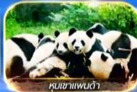
หุบเขาแพนด้า

สัมผัสความงามของธรรมชาติ 2 อุทยาน อุทยานจิวจ้ายโกวและอุทยานน้ำแข็งต้ากู่