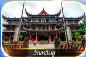
วัดเหวินชู่