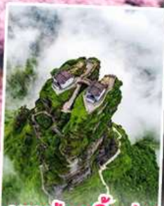
อุทยานกุหลาบพันปี หมู่บ้านแม่วชิเจียง