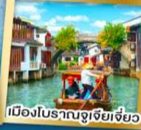
เมืองโบราณจู่เจียเจี้ยว