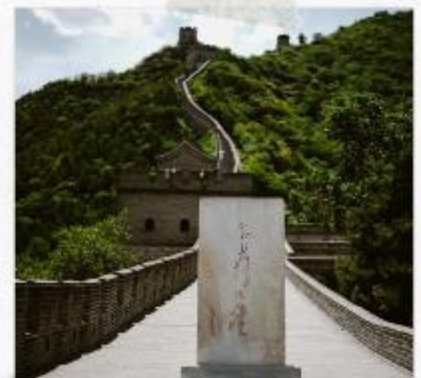
กำแพงเมืองจีน ด่านจวิหยงกวน