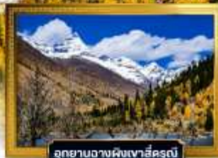
อุทยานฉางผิงเวาสีครุณี