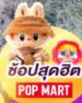
ช้อปสุดฮิต POP MART