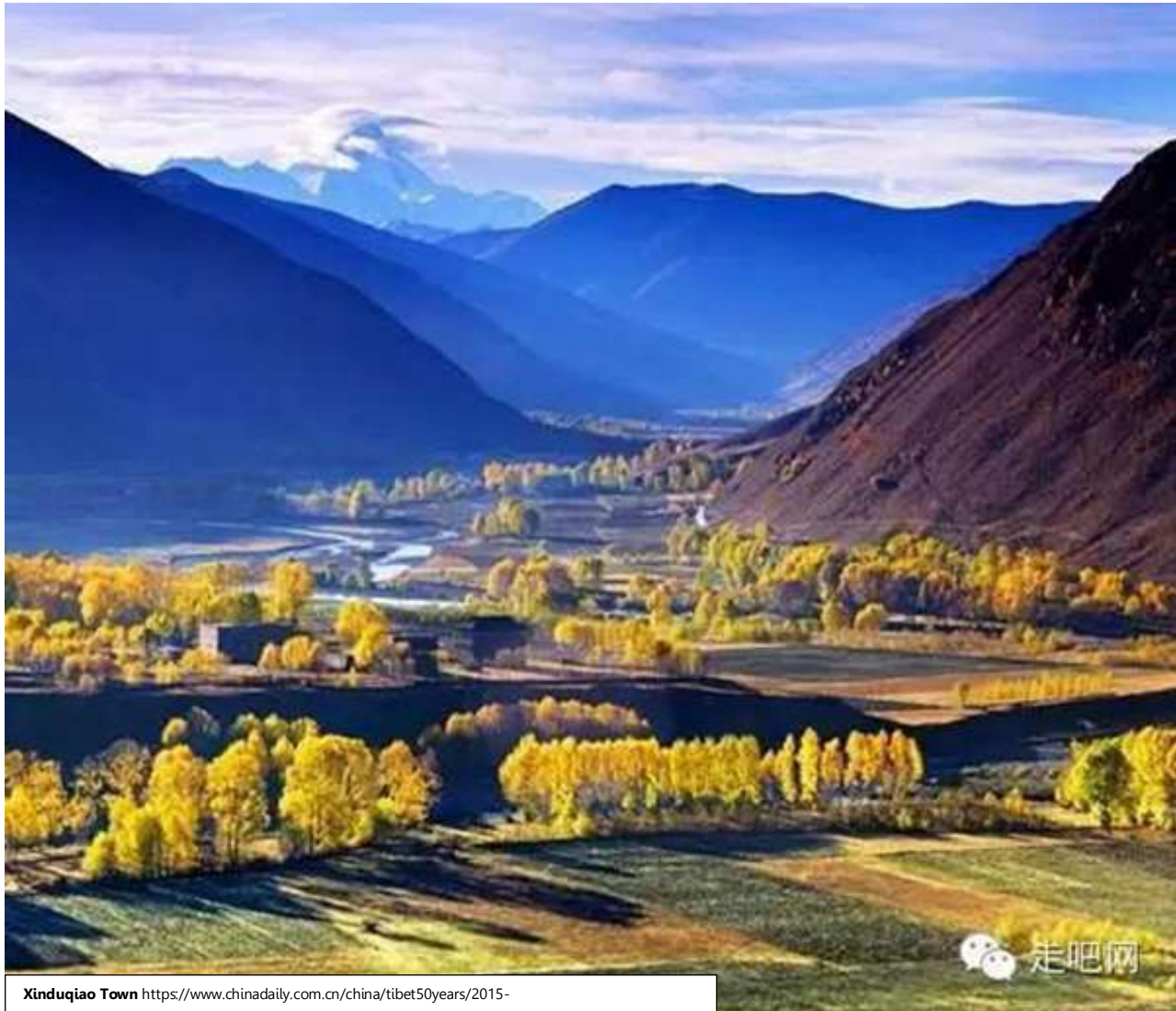
Xinduqiao Town https://www.chinadaily.com.cn/china/tibet50years/2015-

เมืองเล็กๆ อันงดงามที่ตั้งอยู่ทางตะวันตกของเมืองคังคิง ห่างจากเมืองคังคิงประมาณ 78 กิโลเมตร ขึ้นชื่อว่าเป็น "โลกแห่งแสงและเงา" และ "สวรรค์สำหรับช่างภาพ" เพลิดเพลินกับทิวทัศน์ของบ้านสไตล์ทิเบตแบบดั้งเดิม ที่กระจายตัวอยู่ในชนบทอันเงียบสงบ ดมดื่มน้ำทิพย์ที่เหมือนภาพวาด เพลิดเพลินกับทิวทัศน์ของบ้านสไตล์ทิเบตแบบดั้งเดิมที่กระจายตัวอยู่ในชนบทอันเงียบสงบ ดมดื่มน้ำทิพย์ที่เหมือนภาพวาด มีระเบียบถ่ายภาพระยะประมาณ 10 กิโลเมตร นอกเมือง Xinduqiao ซึ่งถือได้ว่าเป็นสถานที่ที่ดีที่สุดในการถ่ายภาพบรรยากาศยามเช้าของ Xinduqiao