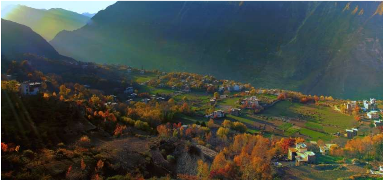
Photo shows the picturesque autumn scenery of Danba county, southwest China's Sichuan Province.

นำท่านนั่งรถของอุทยาน เข้าสู่ ซวงเฉียวโกว หรือ หุบเขาสะพานคู่ มีระยะทาง 34.8 กม. มีพื้นที่รวม 216 ตารางกิโลเมตร จุดท่องเที่ยวแบ่งออกเป็น 3 ส่วน ส่วนแรก หุบเขาหินหยาง หุ่นต้นหยาง แล้วเดินทางเข้าสู่ส่วน ลึกสุดท่านจะได้เห็นธารน้ำแข็ง ภูเขากระจกแก้ว ภูเขาดวงอาทิตย์ ภูเขาดวงจันทร์ ยอดเขากระต่าย ส่วนกลาง นำท่านย้อนกลับมาชมทะเลสาบ ส่วนที่สาม นำท่านชมทุ่งหญ้าเหนียนหยูป่า ชมยอดเขารูปร่างแปลกตา เช่น ยอดเขาพราน ยอดวังโปตาลา ยอดเขาเพชร ภูเขาหญิงตั้งครรภ์ ถ่ายรูปกันอย่างจุใจกับท้องทุ่งกว้างที่มีฉากหลัง เป็นภูเขาสูงปกคลุมด้วยหิมะขาว ในหุบเขาจะมีลำธารใสสะอาด และสนสูงสีเขียวเข้มสลับด้วยต้นไม้หลายหลาก เฉดสี เช่น เขียวอ่อน เขียวแก่ เหลืองส้ม แดง น้ำตาลเข้ม เนื่องจากอยู่ในฤดูกาลใบไม้เปลี่ยนสี