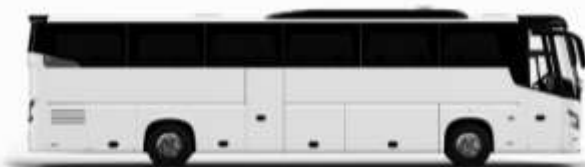
ตัวอย่างรูปการรถ 1 คัน

ค่าที่พักตามที่ระบุในรายการหรือเทียบเท่าระดับเดียวกัน (ห้องพักละ 2 ท่าน) หากประเภทห้องที่ท่านริเวอสนาเดินทาง เช่น ริเวอสห้องพักเป็น TWIN BED หรือ DOUBLE BED ทางบริษัทของสงวนสิทธิ์ในการปรับประเภทห้องพัก เป็นตามที่โรงแรมมีอยู่ โดยไม่ต้องแจ้งให้ทราบล่วงหน้า