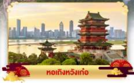
หอถังหวิ่งเก๋อ