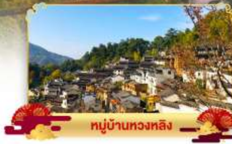
หมู่บ้านหวงหลิ่ง