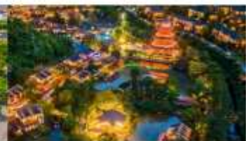
หมู่บ้านเกอเซียน

*ทางบริษัทฯ ขอสงวนสิทธิ์ในการสลับโปรแกรมทัวร์ตามความเหมาะสมขึ้นอยู่กับสถานการณ์หน้างาน โดยคำนึงถึงผลประโยชน์ของลูกค้าเป็นสำคัญ