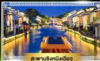
สะพานชิงหมิงเฉียว