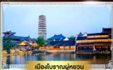
เมืองโบราณฝูหยวน