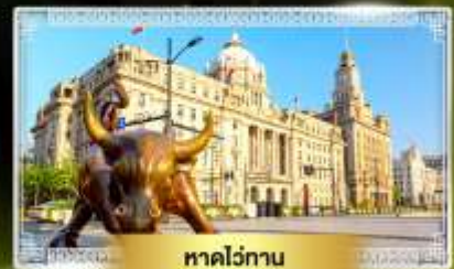
หาดว่อกาน