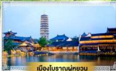
เมืองโบราณฝูหยวน