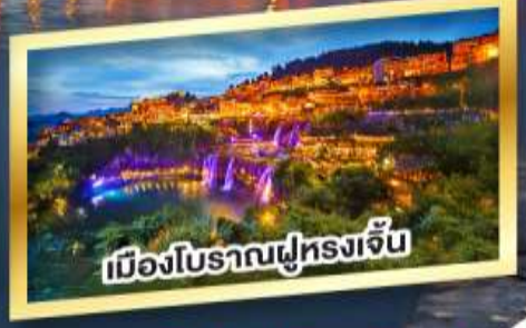
เมืองโบราณฟูหลงเจิ้น