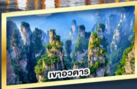
เขาอวดาร